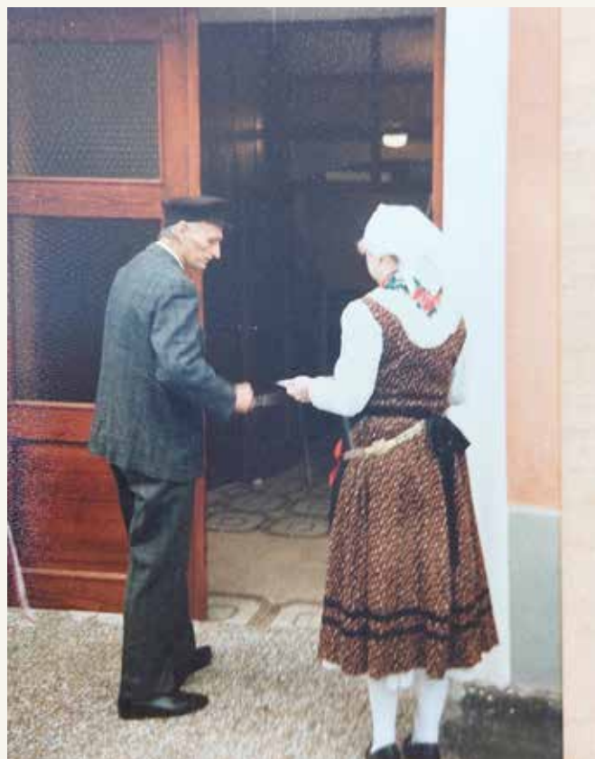
Dom Nine Pokorn Grmovje: 1980 - 2020