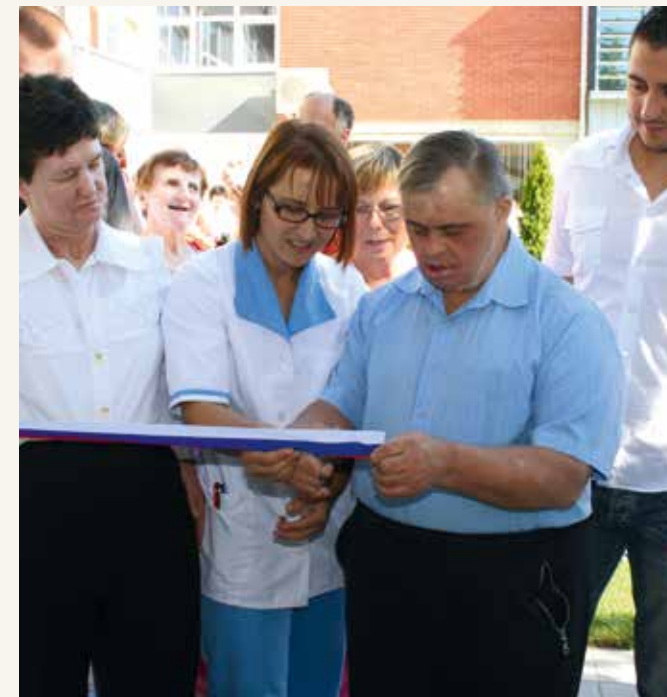
Dom Nine Pokorn Grmovje: 1980 - 2020