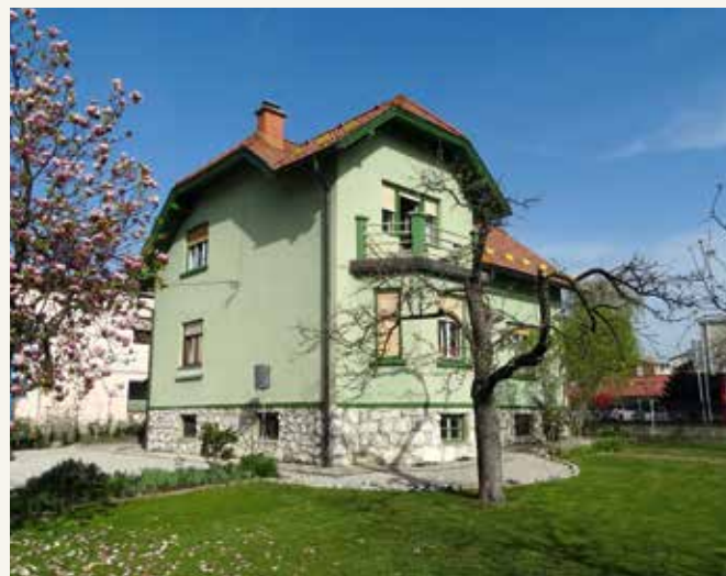
Dom Nine Pokorn Grmovje: 1980 - 2020

»V bivalno enoto sem prišel iz Doma Nine Pokorn Grmovje. Ob selitvi sem čutil strah, nemir, saj si nisem mogel predstavljati, kako se bom navadil. Drugo